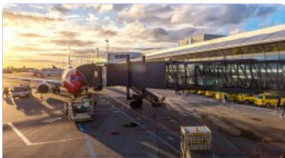
Aeropuertos y estaciones de trenes