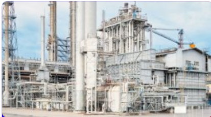
Industria del gas