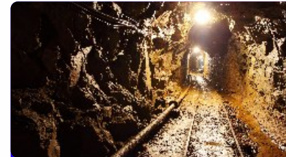
Industria de recursos minerales