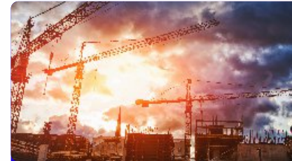
Industrias de la construcción